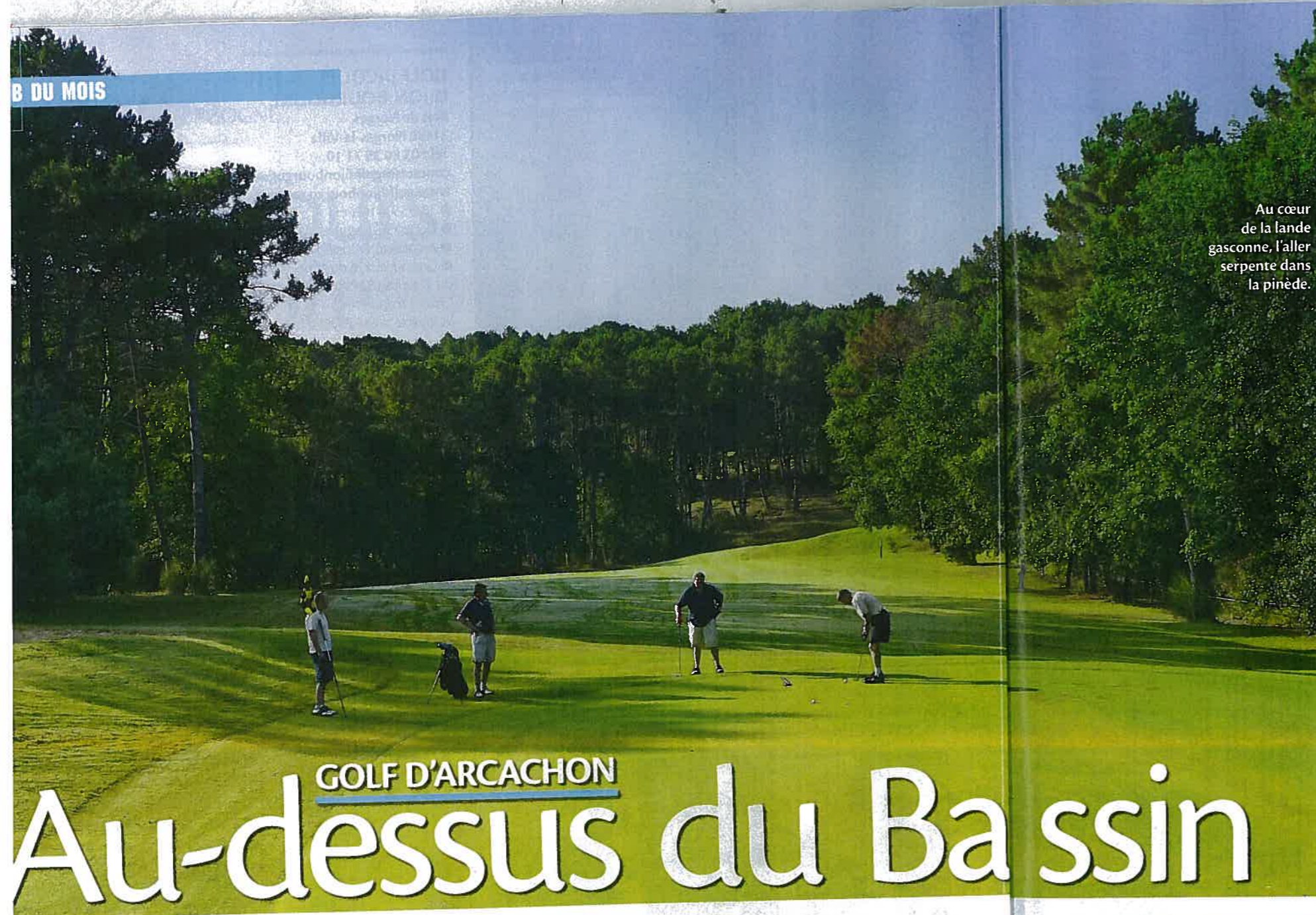
Au cœur de la lande gasconne, l'aller serpente dans la pinède.