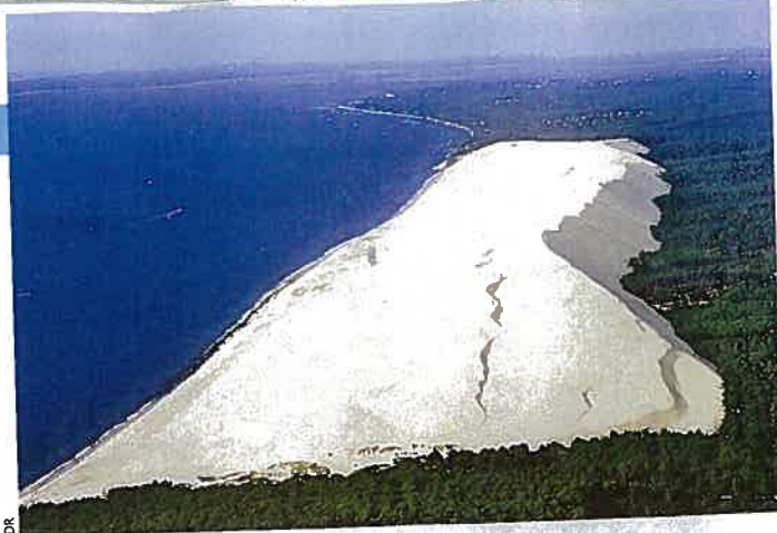
La dune du Pyla, la plus haute d'Europe !